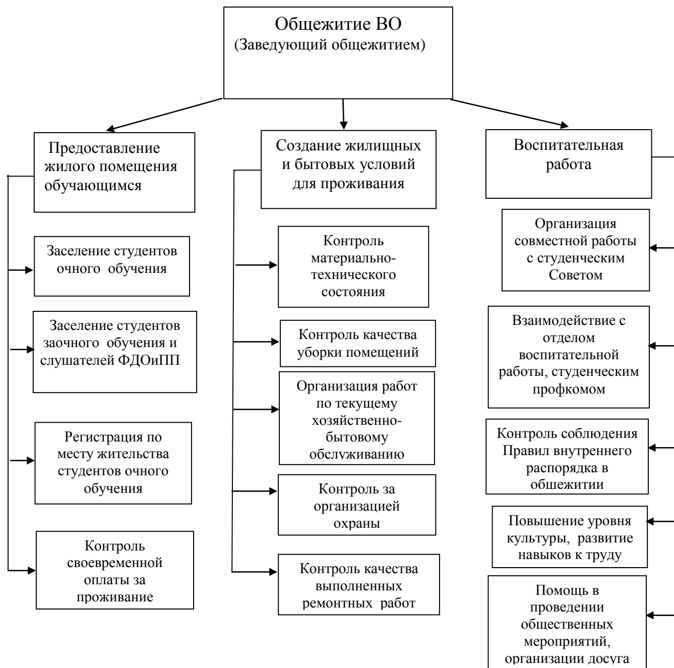
Рис. 1 - Структура функций Общежития ВО